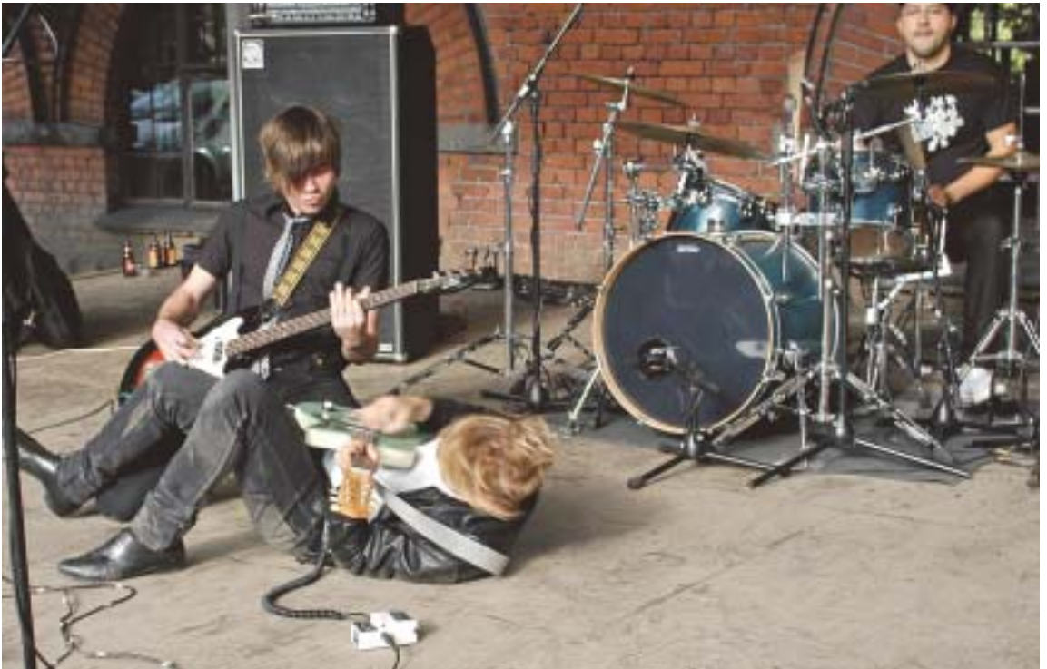
The Sweeties-yhtyeen veijarit ottivat kontaktia väkijoukon lisäksi lattiaan.