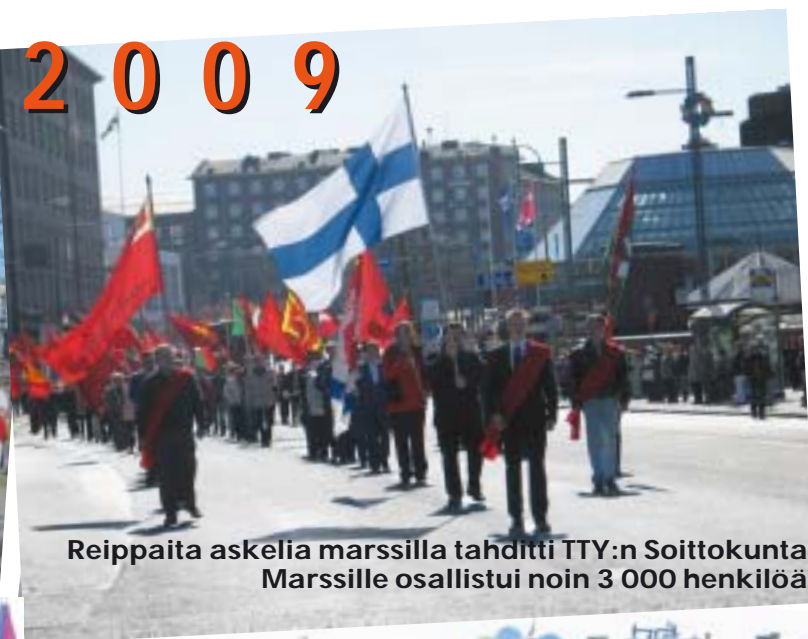
Reippaita askelia marssilla tahditti TTY:n Soittokunta. Marssille osallistui noin 3 000 henkilöä.