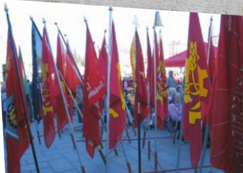
Myös puheita ja lauluja kuunteli runsas joukko.