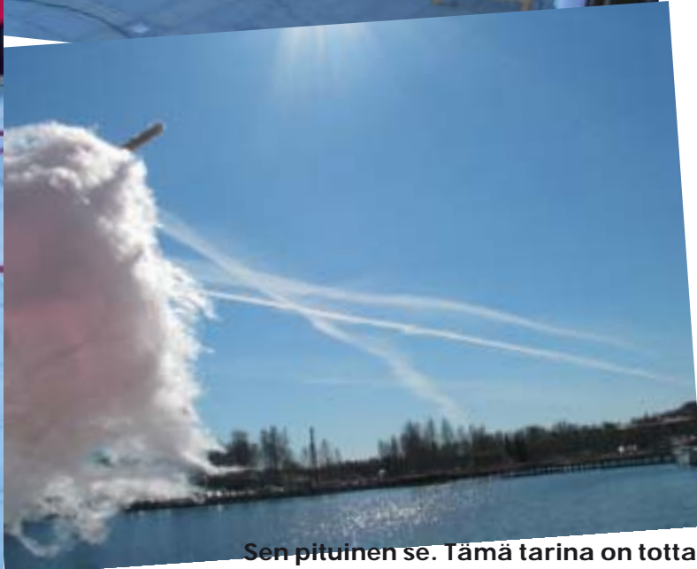
Sen pituinen se. Tämä tarina on totta.