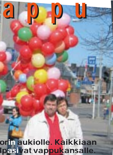
Keskustorin aukiolle. Kaikkiaan osallistuivat vappukansalle.