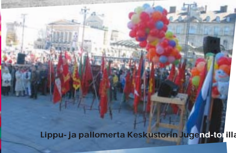
Lippu- ja pallomerta Keskustorin Jugend-torilla