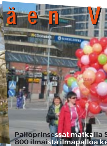
Palloprinsessat matkalla S... 800 ilmaista ilmapalloa ke...