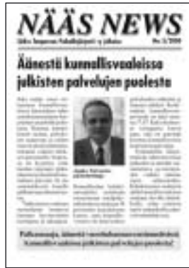
Nääs News 3/2000