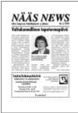
Nääs News 2/2000