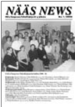
Nääs News 1/2000