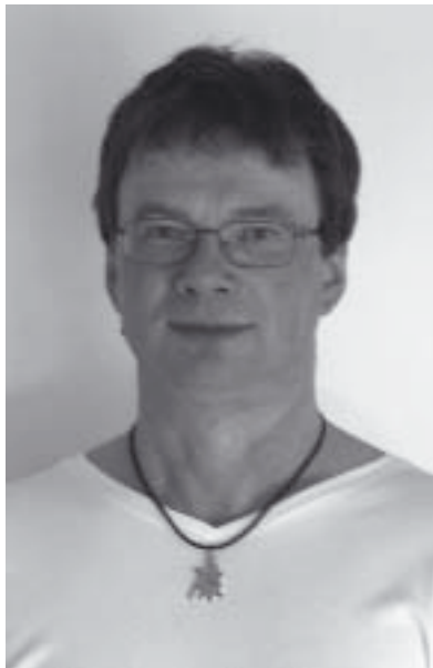
Kuusi: © Ulia Koskiva

Toinen ilmiö taas on se, että tällä hetkellä on valitettavasti olemassa myös huomattava määrä toimijoita, joilla ei ole lainkaan halua hoitaa tehtävi-