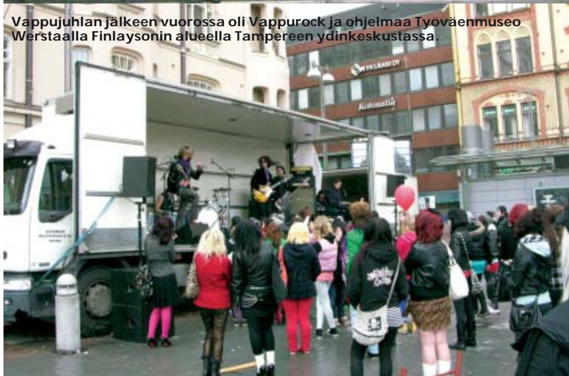
Vappujuhlan jälkeen vuorossa oli Vappurock ja ohjelmaa Työväenmuseo Werstaalla Finlaysonin alueella Tampereen ydinkeskustassa.