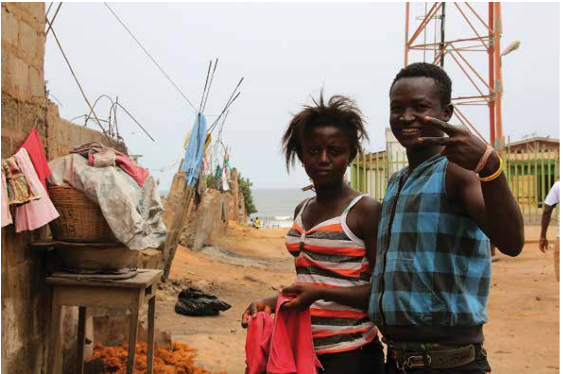
Lokaalit rannalla tuulen tuivertaessa.

Muita Ghanan reissuaiheisia tekstejä on luettavissa täältä: http://pamghanassa.blogspot.com