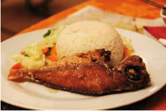
Munchin Huuto -tyyppinen kalailallinen.

TUTUKSI TULI myös mm. Työväenliikkeen keskus TUC ja ILO, eli Kansainvälisen työjärjestön toimisto. ILO:n tilaisuudessa meille kerrottiin lapsityövoimasta ja muista karuista ongelmista. Lähes poikkeuksetta kaikissa afrikkalaisen työelämän ilmiöissä hyötyjinä ovat rikkaat ja uhreina köyhät. Ihmisoikeudetkin ovat käytännössä vain silmälumetta ja puuhastelua. Globaalissa maailmantaloudessa tulot kerätään köyhien selkänahasta ja tuloerot ovat härskejä. Paikallisellakin pikaruokalalla oli venäläinen omistaja.