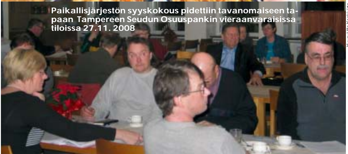
Paikallisjärjestön syyskokous pidettiin tavanomaiseen tapaan Tampereen Seudun Osuuspankin vieraanvaraisissa tiloissa 27.11.2008