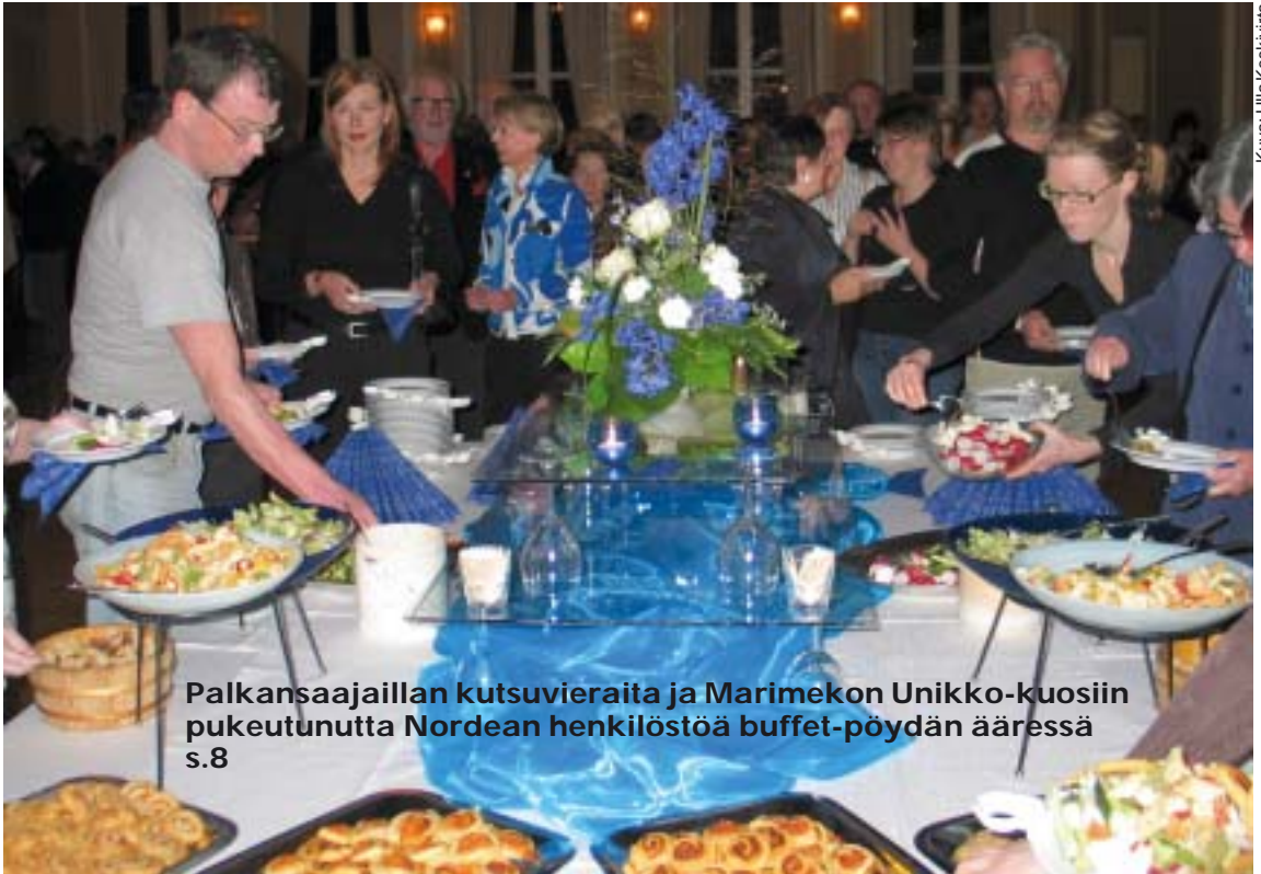
Palkansaajailan kutsuvieraita ja Marimekon Unikko-kuosiin pukeutunutta Nordean henkilöstöä buffet-pöydän ääressä s.8