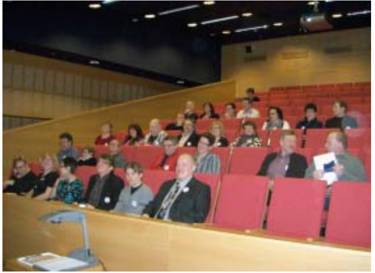
Länsi-Suomen yhteisseminaarin yleisöä.